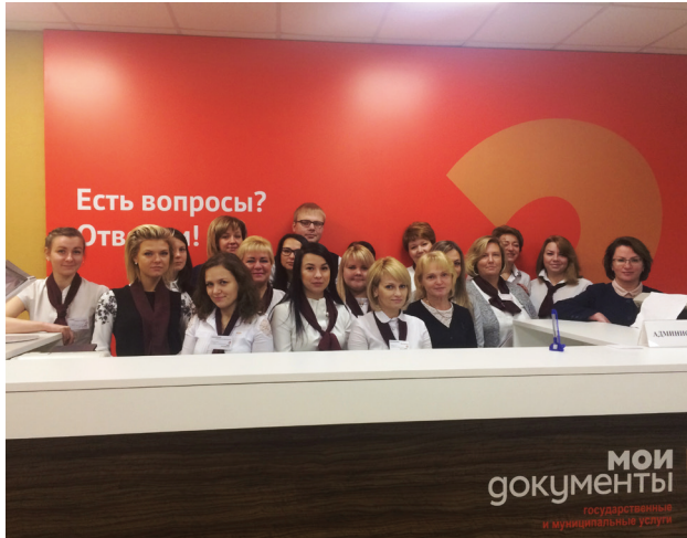
Коллектив отделения по Октябрьскому округу ГОБУ «МФЦ МО»